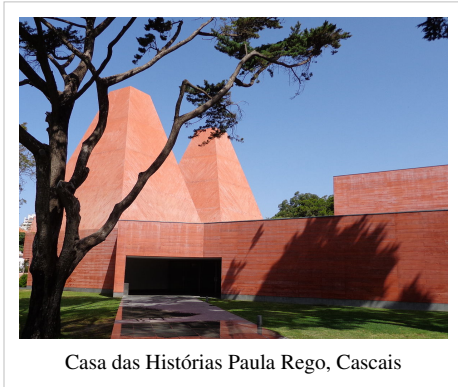
Casa das Histórias Paula Rego, Cascais